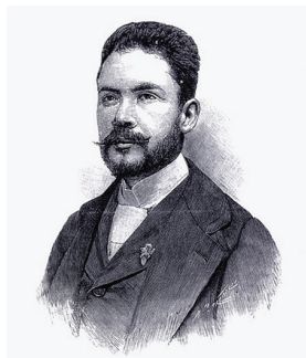
Retrato de Rubén Darío, 1892.

gros y respetados magistrados de la capital tenía amores con una dama casada con un extranjero. Como el marido oyese ruido una noche, se levantó y se dirigió al comedor en donde estaba oculto el amante de su mujer. Éste se arrojó sobre el pobre hombre y lo mató encarnizadamente, con un puñal. La posición del joven, y sobre todo la del padre, aumentaban lo trágico del crimen. El asesino estuvo preso por algún tiempo y luego creo que le fue facilitada la fuga. Años después, reducido a la pobreza, se le encontró