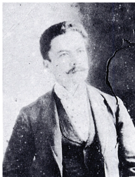
Rubén Darío en 1888.