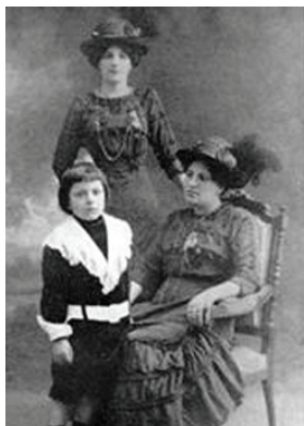
Rubén Darío, foto familiar..

lazquescos, hombre y mujer. Él se llamaba el capitán Vilches, y la mujer era su madre; pero eran iguales completamente, en tamaño, en fealdad, y me inspiraban miedo e inquietud. Hacían retratos de cera, monicacos deformes, y el “capitán”, que decía ser también sacerdote, pronunciaba sermones que hacían reír, pero que yo oía con gran malestar, como si fuesen cosas de brujos.