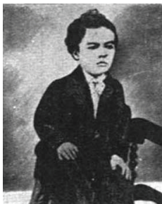
Rubén Darío niño.

trífugos y centrípetos, como los que forman la linterna mágica, creaban una visión extraña y para mí dolorosa. El central punto rojo se hundía, hasta incalculables hípnicas distancias, y volvía a acercarse; y su ir y venir era para mí como un martirio inexplicable. Hasta que, de repente, desaparecía la decoración de colores, se hundía el punto rojo y se apagaba, al ruido de una seca y para mí saludable explosión. Sentía una gran calma, un gran alivio; el sueño seguía, tranquilo. Por las mañanas mi almohada estaba llena de sangre, de una copiosa hemorragia nasal.