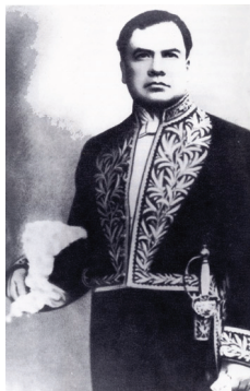
Rubén Darío con el uniforme de embajador, 1908.

un joven bien pertrechado de los más diversos conocimientos, y hecho a toda suerte de disciplinas. Una vez concluida mi conversación con el monarca, pasé a presentar mis respetos a las reinas. La reina Victoria apareció ante mi vista como una figura de arte. Por su rosada belleza, la pompa rica de su elegancia ornamental, y hasta por la manera como estaba dada la luz en el estrecho recinto donde me recibió de pie y me tendió la mano para el beso